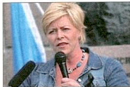
Siv Jensen, la «Marine le Pen» norvégienne.

Environ 92 000 «landviskere» («traîtres à la Patrie») furent épurés, mais pour la plupart avec des peines de principe dont, à partir de 1949, bon nombre – en pleine «guerre froide» bat son plein – furent amnistiés. Pendant les années qui suivirent, l'extrême-droite, discréditée par la collaboration avec l'occupant, se fit relativement discrète, de petits groupes de nostalgiques se manifestant cependant.