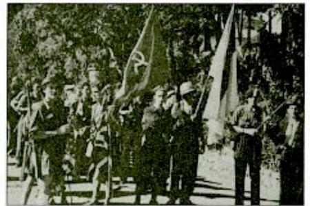
Entrée des FFI à Monaco le 3 septembre 1944.