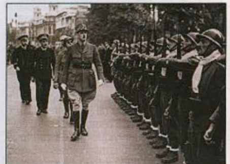
14 juillet 1940, le général de Gaulle passe en revue à Londres les premières FFL.

par les Britanniques le 3 juillet 1940 et visant à s'assurer de l'escadre française mouillée à Mers-el-Kébir, près d'Oran en Algérie, afin qu'elle ne tombe pas sous le contrôle de l'Allemagne va conduire à un meurtrier affrontement entre la Royal Navy et la flotte française 1 , ainsi qu'à la rupture le 4 juillet des relations diplomatiques entre Vichy, où le gouvernement Pétain a été installé, et Londres.