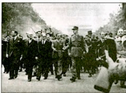
La République rentre chez elle à la Libération.

Fin 1943, 37 Etats avaient reconnu la France combattante, présente sur tous les fronts : en Italie avec le corps expéditionnaire de Juin (qui s'illustrera le 25 janvier 1944 à Monte Cassino), dans le Pacifique ou sur le front russe, où combat l'escadrille « Normandie »,