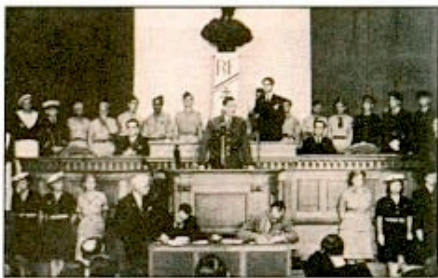
Le général de Gaulle à la tribune de l'Assemblée Consultative Provisoire à Alger.

Le 3 juin naît le Comité Français de la libération nationale (CFLN) , placé sous la co-présidence des généraux de Gaulle et Giraud et qui, le 17 septembre 1943, décide de se doter d'une « Assemblée consultative provisoire » (ACP) où siègeront 49 représentants de la Résistance métropolitaine choisis par le CNR, 12 représentants de la Résistance extra-métropolitaine, 20 sé-