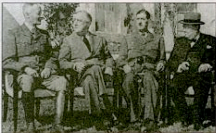
A Anfa, près de Casablanca, Roosevelt et Churchill font pression pour imposer un accord Giraud-de Gaulle.

pour la France libre, alors même qu'échappent à Vichy des territoires économiquement importants, qu'échappent à Vichy des territoires économiquement importants, des forces armées notables et une population européenne («Pieds noirs») conséquente.