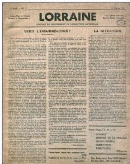
Début 1944, Lorraine est devenu l'un des organes du MLN.