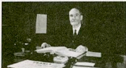
René Cassin, juriste éminent, il sera l'un des principaux inspirateurs des institutions de la France Libre.

Cependant par cet accord du 7 août 1940, «la France libre» a été reconnue comme seule représentante des intérêts de la France en guerre et reçoit