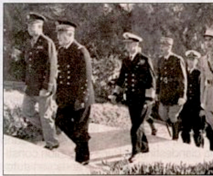
A Alger, le général Eisenhower et l'amiral Darlan suivis par l'amiral britannique Cunningham et le général Giraud...

Paradoxalement, cette prise de contrôle par les Alliés de l'Afrique française du Nord (AFN), à l'exception de la Tunisie occupée par les germano-italiens, va être une source de difficultés