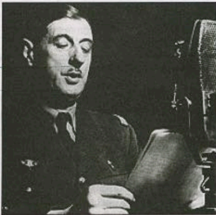
Le général de Gaulle au micro de la BBC.