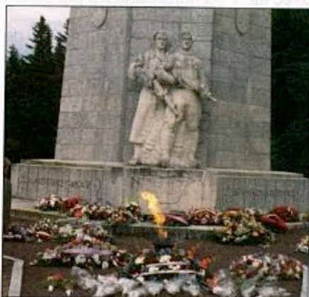
Sur la tombe du maquisard inconnu inhumé-là, brule la flamme du souvenir...