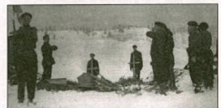
L'enterrement de Tom Morel sur le plateau des Glières

Inhumé le 13 mars, le corps de Tom Morel sera descendu le 2 mai 1944 dans la vallée. Il repose aujourd'hui dans la Nécropole des Glières au cimetière Militaire de Morette.