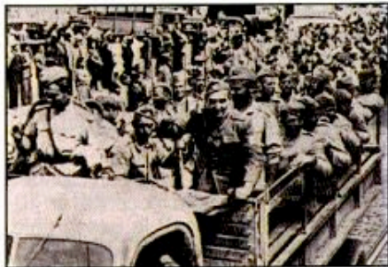
La division Todor Vladimirescu entre en Roumanie...

D'autres formes de résistance existent aussi : sauvetage de Juifs, prise en