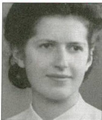
Genevieve Anthonioz-de Gaulle