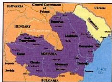
L'évolution des frontières de la Roumanie. Elle doit céder la Transylvanie du Nord à la Hongrie, le sud de la Dobroudja sur la côte à la Bulgarie et, en 1940-1941, le nord de la Bukovine et la Bessarabie à l'URSS. En jaune, la Transnistrie, occupée par la Roumanie de 1941 à 1944.

Le 14 septembre 1940, après des émeutes populaires ayant débouché sur un massacre, le Maréchal Ion Antonescu – qui avait été nommé premier ministre le 3 septembre, et qui se qualifie lui-même de «Pétain roumain» – prend le titre de «Conducator» (Guide de l'État, analogue aux titres de Führer, Duce, Caudillo...) et proclame la Roumanie «État national légionnaire». La «Garde de fer», qui prend le nom de «Mouvement légion-