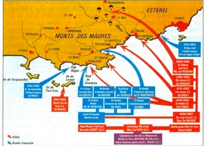
L'assaut allié sur les côtes de Provence...

PARIS. Alors qu'après leur victoire en Normandie les Alliés avancent vers Paris, les cheminots se mettent en grève le 10 août 1944, suivis par les employés du métro de Paris et la gendarmerie le 13 août, la Police le 15 août, les postiers le 16 août. La grève est générale le 18 août... Le colonel Rol-Tanguy, chef des FFI d'Ile-de-France, donne l'ordre de l'insurrection. La ville se couvre de barricades, des combats ont lieu avec les Allemands à la Préfecture de police, des accrochages ont lieu dans toute la Ville... C'est une ville soulevée qui accueille la 2 e DB le 24 août, une ville libérée – où le commandant du Gross Paris a capitulé devant Leclerc et Rol – qui reçoit le général de Gaulle le 25 août.