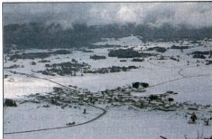
Le site de Vassieux-en-Vercors, en hiver.

misées au Conseil National des cinq collectivités ayant reçu la distinction. Parmi elles, aux côtés de Nantes, de l'Île de Sein, de Grenoble et Paris, Vassieux-en-Vercors, qui fut fait Compagnon de la Libération le 4 août 1945.