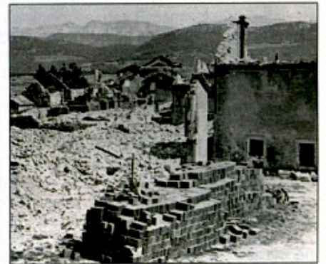
Les ruines de Vassieux-en-Vercors.

Après des opérations sur le pourtour du Massif testant notamment ses défenses, les Allemands vont passer à l'offensive, notam-