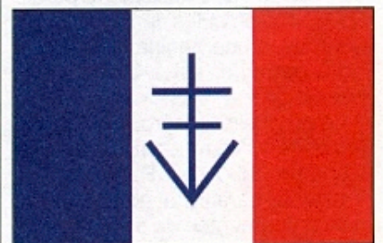
Le drapeau de la « République du Vercors »

(Vassieux-en-Vercors, Compagnon de la Libération par décret du 4 août 1945)