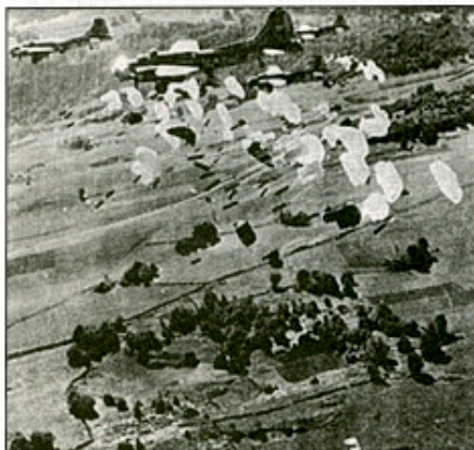
Parachutage sur le Vercors.

L'entrée des troupes allemandes en Zone sud va être suivie, le 26 novembre 1942, d'un ordre d'Hitler de dissoudre « l'armée d'Armistice » (100 000 hommes en Métropole), c'est-à-dire l'armée du Régime pétainiste ; dissolution qui doit être achevée le 23 janvier 1943. Cela va conduire dans les mois qui vont sui-