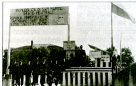
En allemand, français, anglais et italien : «San Marino, Etat neutre»...

Les fascistes san-marinaises vont partager le sort de ceux d'Italie où, conséquence de l'invasion alliée de la Sicile, Mussolini a perdu le pouvoir le 24 juillet 1943, et a été arrêté, le Parti fasciste étant dissous le 28 juillet. Ce même jour, le même sort va être réservé au Parti fasciste san-marinaise : le 28 juillet 1943, le «Comitato de la Liberta» prend le pouvoir et les