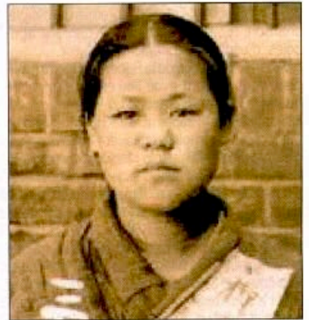
Ryu Gwan-sun, héroïne de la résistance antijaponaise, torturée, coupée en trois au sabre.

Dès les premiers temps de l'annexion, les occupants japonais s'étaient signalés par leurs brimades et leurs exactions, lesquelles, à l'annonce la mort de l'ancien roi Kojong,