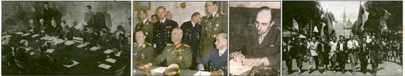
A gauche, la reddition allemande à Reims ; au centre, Keitel va signer la capitulation à Berlin, que contresigne pour la France le général de Lattre de Tassigny. A droite, en France, à l'annonce de la Victoire...

Le premier semestre de l'année 1945 aura vu, avant l'écroulement final du Reich hitlérien, se dérouler en Europe les dernières grandes batailles contre l'armée nazie et ses derniers alliés : dès janvier dans les Ardennes belges, où la Wehrmacht a été stoppée dans sa contre-offensive avant d'être repoussée en deçà des frontières du Reich, en Alsace et en Lorraine, que les troupes allemandes doivent évacuer totalement avant que les troupes américaines et françaises de la 1 re Armée de de Lattre ne les poursuivent en Allemagne jusqu'au Rhin, atteint le 14 février, en Pologne où l'Armée rouge libère Varsovie le 22 janvier avant d'atteindre l'Oder le 23 janvier. A l'Est, où Auschwitz est libéré le 27 janvier, et à l'Ouest, les Alliés vont découvrir l'horreur des camps nazis. Dès lors le repli allemand va se généraliser : en Hongrie, Budapest est prise par les Soviétiques le 13 février après 50 jours de combat, le 6 mars Cologne est prise par les Alliés qui franchissent le Rhin à Remagen le 7 mars, le 29 mars, les troupes soviétiques entrent en Autriche et à Vienne le 16 avril, le 14 avril précédent, les Pays-Bas ont été libérés, le 19 avril, après avoir franchi l'Oder, les Soviétiques sont entrés dans Berlin, le 21 avril les Français ont pris Stuttgart, le 28 avril, en Italie, Mussolini a été fusillé par des partisans.