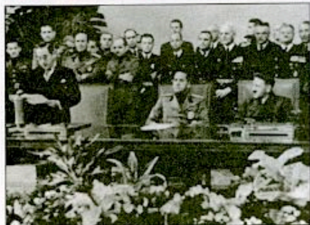
Saburo Karusu, ambassadeur du Japon à Berlin, aux côtés d'Hitler et de Ciano.

Le 27 septembre 1940, Saburo Karusu, ambassadeur du Japon à Berlin signait avec Hitler et Ciano, le gendre de Mussolini et son ministre des Affaires étrangères, un Pacte tripartite liant son pays à l'Allemagne et l'Italie, deux pays en guerre avec la Grande-Bretagne et qui ont à cette date occupé après une agression plusieurs pays européens. 1 Le Japon leur était déjà lié par le Pacte anti-Komintern, signé en 1936-1937 et dirigé contre l'URSS. 2