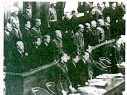
La salle d'audience du Tribunal de Tokyo

Au total, environ 6 000 000 de Chinois, de Malais, d'Indonésiens, de Coréens, de Birmans, de Philippins et d'Indochinois, ainsi que des prisonniers de guerre et civils occidentaux. Les «Oradour», «Lidice», «Baby-Yar» furent légion dans la «Grande Asie» sous domination japonaise.