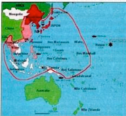
L'extension maximale des forces japonaises.

Le repli japonais commencera aux Salomon, où se déroulera d'août 1942 à février 1943 la bataille de Guadalcanal, et qui seront libérées fin 1943. Mais il faudra encore près de deux ans de combats et d'innombrables souffrances – dont celles du peuple japonais – et hélas deux bombes atomiques pour contraindre le Japon à la reddition le 2 septembre 1945.