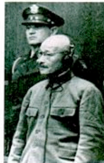
Le général Tojo