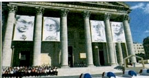
La cérémonie du Panthéon