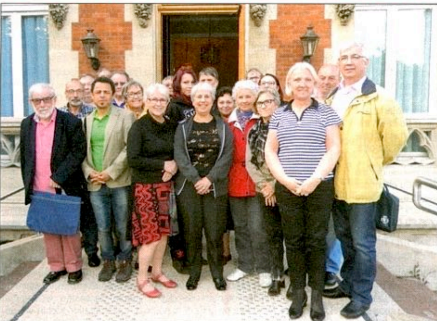
Du 8 au 10 mai 2015 s'est déroulé à Saint-Denis le stage national de formation de l'ANACR (voir page 20).