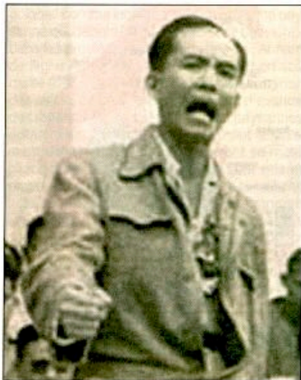
Luis Taruc, leader des Huks