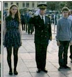
A Ajaccio, le Préfet, le 27 mai...