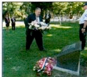
Paris, devant les Stèles Jean-Moulin

Pour la seconde année consécutive, la Journée Nationale de la Résistance a été célébrée le 27 mai dans la quasi-totalité des départements, le plus souvent avec la participation des autorités de l'Etat. Nous évoquons ci-dessous cette commémoration dans quelques départements. Dans nos deux prochaines éditions, nous l'évoquerons dans plusieurs autres.