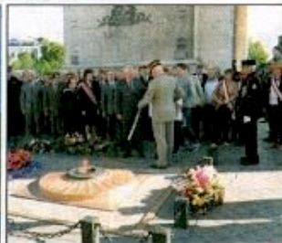
Le ravivage de la Flamme