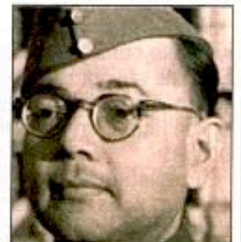
Écusson de l' Indische Legion , ici inspectée par Rommel à Lacanau (Gironde) ; à droite Subhash Chandra Bose.

Le 26 août 1942, plusieurs centaines de «volontaires» prêtent serment à Hitler et constituent l' Indisches Infanterie-Regiment 950 (ou Legion Hazad Hind ) ; ils seront 3 500 fin 1942. L'ambition de Chandrah Bose, qui rencontre Hitler et Himmler, sera de faire de cette unité l'embryon d'une «armée de libération» de l'Inde, accompagnant la Wehrmacht dans une offensive à travers le Caucase et la Perse (Iran) pour rejoindre sur le sol indien les forces japonaises arrivant par l'Est.