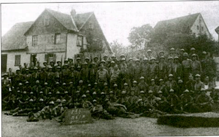
Sur l'écrêteau : 1 re A.F., 19 e G.I.P., 5 e compagnie, en août 1945 à Villingen (Pays de Bade).

À la mi-novembre 1945, Le Gouvernement Provisoire de la République Française ayant reconnu le Gouvernement de Varsovie aux lieux et place de celui de Londres, les 19 e et 29 e G.I.P. gagneront la Pologne, où ils seront reçus avec tous les honneurs.