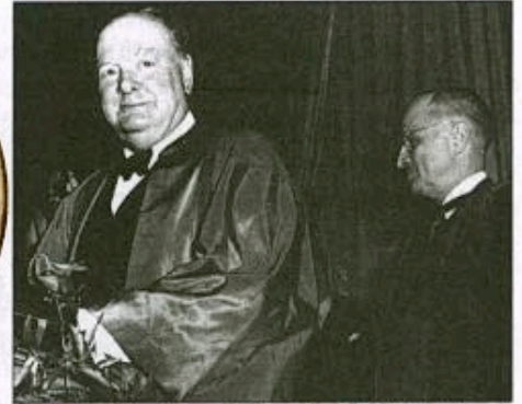
De g. à d. : 10 janvier-14 février, la 1 re réunion de l'Assemblée générale des Nations-unies à Londres, Trygve Lie, 1 er secrétaire général de l'ONU ; 8 avril : création de la Cour Internationale de Justice à la Haye ; Churchill, le 5 mars à Fulton, avec derrière lui Harry Truman : «Un rideau de fer...»

Plus de 60 millions de morts, des dizaines de millions de blessés, des régions entières dévastées, des villes rayées de la carte, tel est en ce début 1946, quatre mois après la capitulation du Japon qui en marqua la fin, le tragique bilan que l'on peut dresser de ce que l'histoire va appeler la Seconde Guerre mondiale.