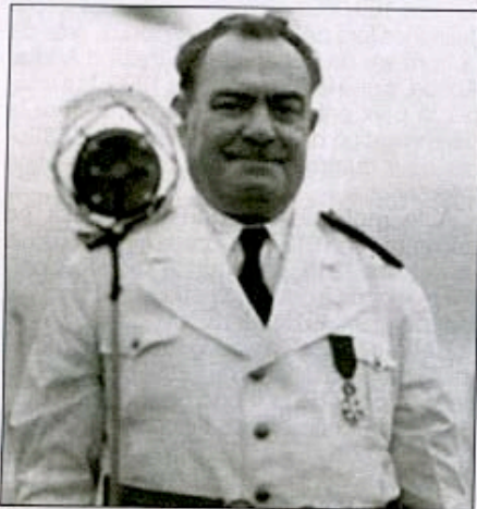
Le gouverneur Louis Bonvin

L'histoire de la pénétration européenne en Inde est jalonnée de conflits entre les puissances coloniales et les souverains indiens, mais aussi entre elles.