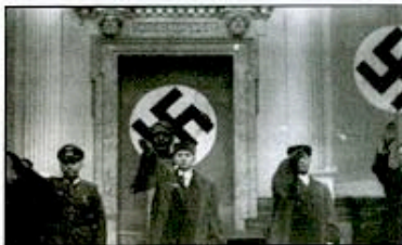
Ouverture d'une séance du Tribunal du peuple nazi.

Celui qui fut le symbole de la «Justice» nazie, le sinistre et vociférant Roland Freisler, nommé le 20 août 1942 par Hitler président du Volksgesichtshof («Tribunal du peuple») qui, sous