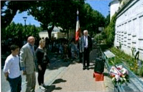
à Manosque toute proche