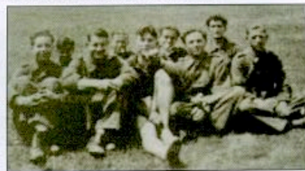
Groupe de maquisards de Vanosc

Les libérés seront hébergés quelque temps à Vanosc puis à Saint-Egrève avant de retrouver leurs familles.