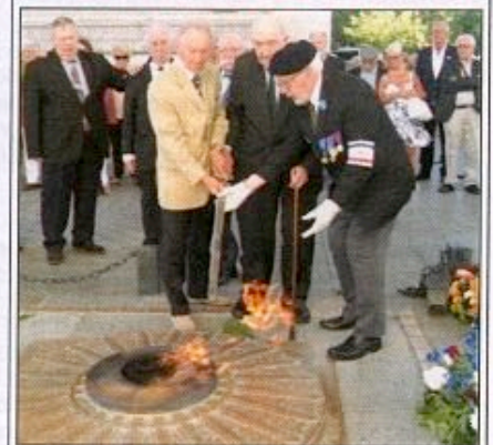
Sur la tombe du Soldat inconnu, le 23 août (voir p. 20)