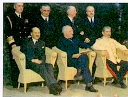
A Potsdam : Clement Attlee, Harry Truman et Joseph Staline.

des grands criminels de guerre des puissances européennes de l'Axe» et fixant le statut d'un «Tribunal Militaire International (...) pour juger et punir de façon appropriée et sans délai, les grands criminels de guerre des pays européens de l'Axe».