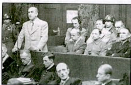
Oswald Pohl devant le tribunal de Nuremberg.

Seule la peine capitale prononcée à l'égard d'Oswald Pohl sera exécutée : il est pendu le 7 juin 1951 à la prison de Landsberg. Pohl avait adhéré au Parti nazi et rejoint sa Section d'assaut ( Sturmabteilung , S.A.) en 1925 puis en 1933 la SS, dont il devendra le 1 er juin 1935 trésorier national et chef de l'administration. Mettant en place la structure d'administration des camps de concentration, il devient quatre ans plus tard chef de l'«Office central d'Administration et