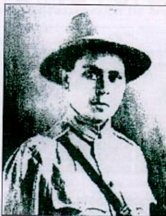
Kebedech Seyoum, résistante éthiopienne.

Ras Kassa Haile Darge ; elle réussira à créer sous son commandement une véritable armée, qui s'affrontera à quatorze reprises avec les Italiens avant de se replier au Soudan 7 .