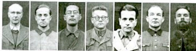
Les 7 condamnés à mort : de g à dr. : Viktor Brack, Karl Brandt, Rudolf Brandt, Karl Gebhart, Valdemar Hoven, Joachim Mrugovsky, Wolfram Sievers.

Et des médecins et infirmières prêteront leur concours au meurtre, au gazage par millions de populations civiles, de déportés. Ce sont 23 d'entre eux, dont une femme – Herta Oberheuser, médecin à Ravensbrück – qui, le 2 août 1947, entendent le verdict de leurs juges :