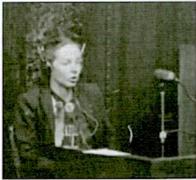
Marie-Claude Vaillant-Couturier déposant au Procès de Nuremberg.

Le 28 janvier 1946, Marie-Claude Vaillant-Couturier, déportée à Auschwitz le 23 janvier 1943 par le convoi dit des «31 000», avec 229 autres Résistantes françaises (la moitié étant communistes), dont seules 43 survécurent, témoigne à Nuremberg :