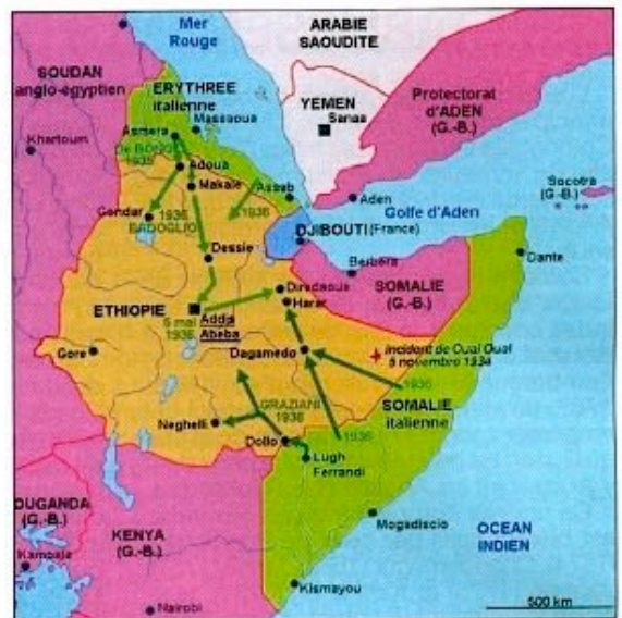
En vert, les possessions italiennes, en bleu françaises (Djibouti-Côte des Somalis), en rose britanniques. Les flèches vertes sont les axes d'attaque italiens contre l'Éthiopie.

L'expansion italienne vers l'intérieur du continent depuis l'Erythrée et la Somalie va se heurter à l'Empire éthiopien, sur lequel l'Italie a des visées pour réunir territorialement