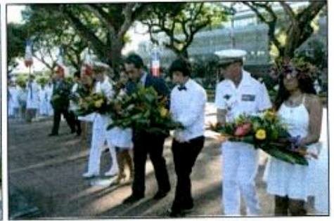
... et dans lointaine Papeete