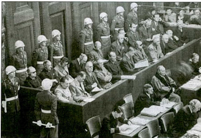
Premier rang, de gauche à droite : Hermann Göring, Rudolf Hess, Joachim von Ribbentrop, Wilhelm Keitel, Ernst Kaltenbrunner, Alfred Rosenberg, Hans Frank, Wilhelm Frick, Julius Streicher, Walther Funk, Hjalmar Schacht. Deuxième rang, de gauche à droite : Karl Dönitz, Erich Raeder, Baldur von Schirach, Fritz Sauckel, Alfred Jodl, Franz von Papen, Arthur Seyss-Inquart, Albert Speer, Konstantin von Neurath, Hans Fritzsche.