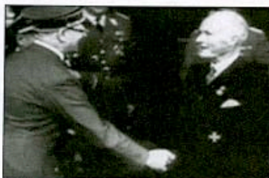
Hitler remet l'insigne d'or du Parti nazi à Gustav Krupp.

« Les Etats-Unis d'Amérique contre Alfred Krupp et consorts ». Ce dixième procès à Nuremberg va concerner une entreprise symbole de la sidérurgie allemande et de sa mise au service du