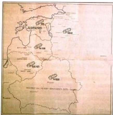
Carte jointe par Stahlreker à son rapport envoyé à Heydrich le 31 janvier 1942.

tor Arajs, aura assassiné entre le 22 juin et décembre 1941, selon le rapport envoyé par Stahlrecker à Berlin, près de 250 000 Juifs, auxquels il faut joindre des dizaines de milliers de Tziganes, de « communistes ».