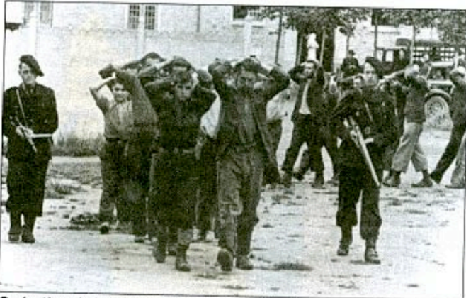
Opération de la Milice contre des Résistants.

Au commencement était la « Légion française des Combattants » (L.F.C.), créée à l'initiative de Xavier Vallat, secrétaire général aux Anciens Combattants auprès du Gouvernement de Vichy, par une Loi du 30 août 1940, afin de se substituer aux diverses associations existantes d'Anciens Combattants dissoutes.