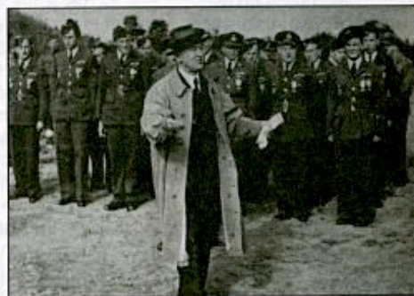
Le président Benès avec des aviateurs des Forces Tchécoslovaques libres.

l'Angleterre, 1 millier y arriveront par d'autres voies, la plupart des autres seront démobilisés après deux mois d'internement à Agde ; beaucoup d'entre eux seront versés dans les Groupements de travailleurs étrangers créés par le