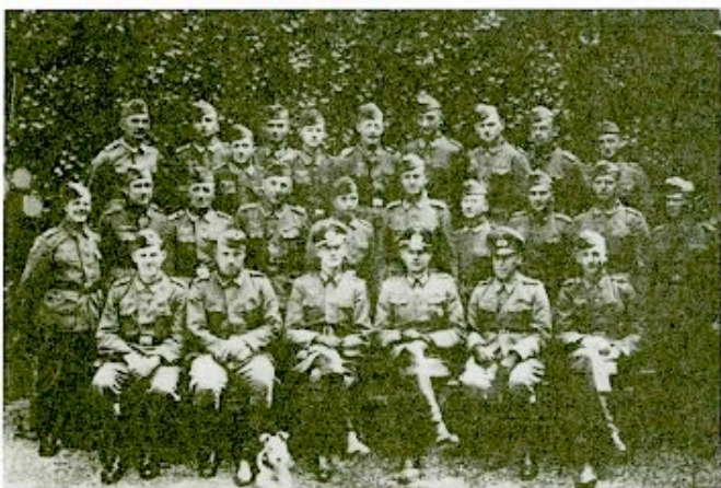
La Feldgendarmarie d'Amiens en mai 1945.

La Feldgendarmarie est une prévôté militaire, assurant tout à la fois des missions de police de la circulation ( Verkehrspolizei ), de police administrative ( Verwaltungspolizei ) mais aussi de police de sûreté ( Sicherheitspolizei ).