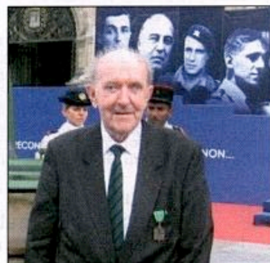
La disparition de Louis CORTOT, Compagnon de la Libération, Président de l'ANACR, a suscité une profonde émotion. Il nous a légué un émouvant message à la jeunesse. (voir pages 2 à 6)