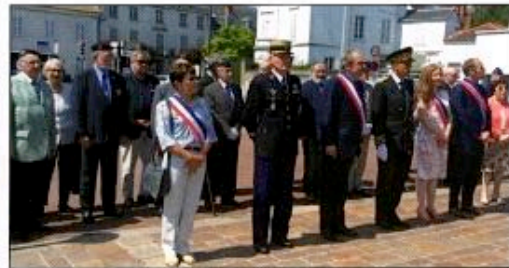
De gauche à droite, des cérémonies, le 27 mai 2017 à Saint-Raphaël (Var), Sevran (Seine-Saint-Denis) et Melun (Seine-et-Marne)