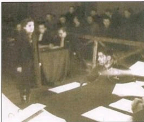
Pendant le Procès de la Maison de la Chimie