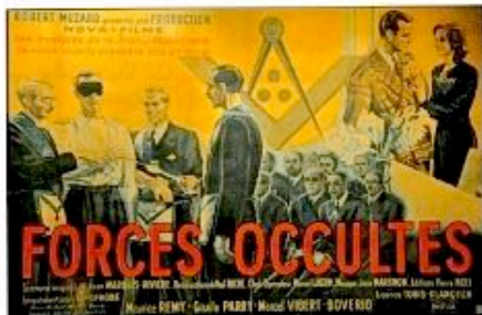
Le film antimaçonnique...

Le 9 septembre 1942 commença, dans les studios Nova-film à Courbevoie, le tournage d'un film réalisé par Jacques de Boistel grâce à une subvention allemande de 1, 2 millions de francs fournie par les Allemands : Forces occultes .