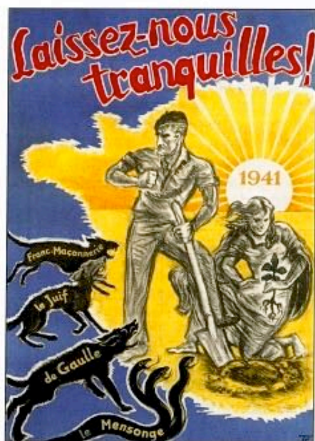
Affiche anti-maçon, antisémite, antigaulleiste.

Dans l'entre-deux guerres, la Franc-maçonnerie est l'objet d'attaques dans plusieurs pays d'Europe et en France même.