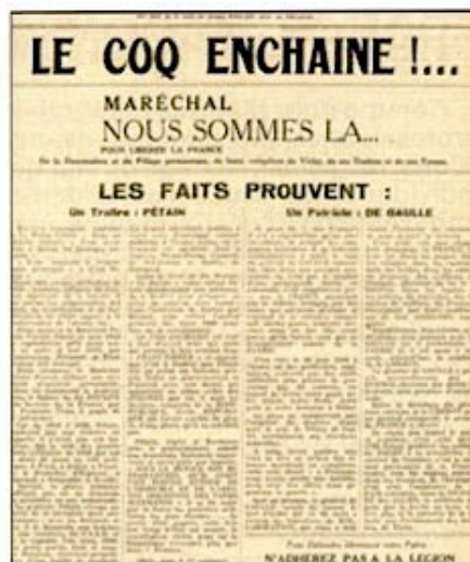
1 er n° du Coq enchaîné, de mars 1942.