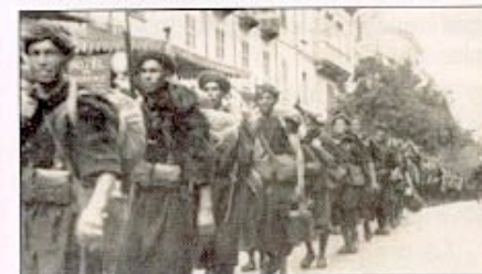
Les premiers goudiers débarquent le 21 septembre à Ajaccio.

Pendant plus d'une semaine, les premières troupes françaises débarquées