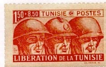
Timbre tunisien de 1944 : de gauche à droite, un soldat anglais, un soldat français et un soldat américain

Le Bey Moncef, à qui est reproché une proximité avec l'occupant allemand, est remplacé sous la pression du général Juin le 15 mai par son cousin, Muhammad al-Amin. (Lamine Bey).