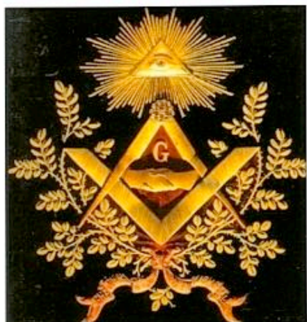
Symboles maçonniques : l'équerre, le compas...

Les origines précises de la Franc-maçonnerie ont fait l'objet de débats, car aux données historiques confirmées se mêlent parfois d'autres, légendaires ou symboliques. Ainsi, certains les font remonter à Adam, à l'Arche de Noé, à la construction du Temple de Salomon, ou encore aux bâtisseurs des... pyramides ; d'où le «rite égyptien» suivi par certaines obédiences maçonniques contemporaines.