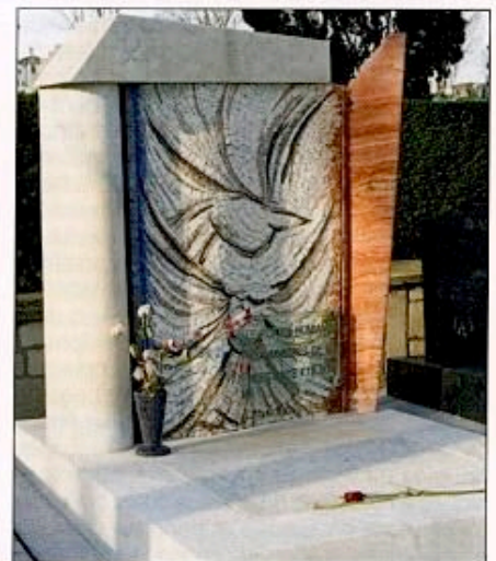
Monument aux FTP-M.O.I. au cimetière parisien du Père-Lachaise

La Guerre froide qui commence conduira du fait des autorités françaises à la cessation de ses activités, dont certaines sont transférées au «Comité d'aide et de défense des immigrés» (CADI).