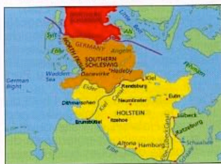
En rouge vif, le nord-Slesvig attribué au Danemark

Jusqu'en 1864, les duchés du Schleswig ( Slesvig en danois) et du Holstein, situés au nord de l'Elbe en Allemagne du nord et qui, tout en ayant fait partie du Saint-Empire Romain Germanique, dépendaient de la couronne danoise jusqu'à la guerre germano-danoise de 1864.