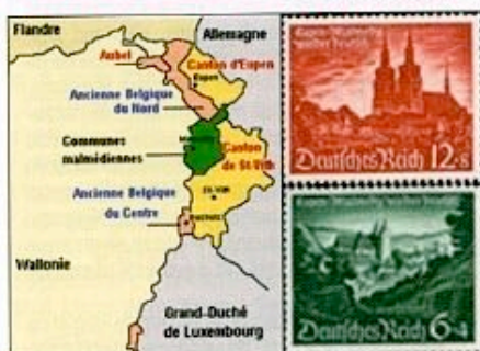
En jaune foncé, les cantons d'Eupen et Saint-With, en vert celui de Malmédy. Les timbres de l'annexion

La région dépendait jusqu'à la fin du XVIII e siècle de la principauté abbatiale de Stavelot, des duchés du Limbourg et du Luxembourg. En 1795, annexée par la France révolutionnaire, elle est intégrée au département de l'Ourthe, et y restera jusqu'à la chute de l'Empire napoléonien en 1815, devenant partie de la Rhénanie prussienne jusqu'en... 1918.