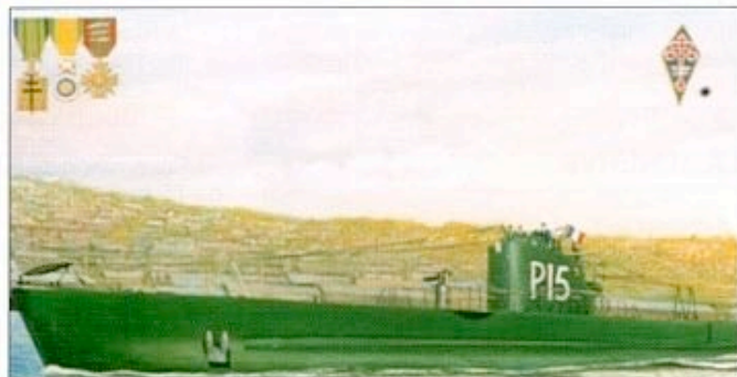
« Le Rubis », compagnon de la Libération, médaillé militaire, Croix de Guerre 39-45.

D'autres sous-marins – le Surcouf , le Minerve , le Junon , l' Orion et l' Ondine – avaient lors de l'offensive à l'Ouest de la Wehrmacht pu quitter Cherbourg pour gagner les ports du sud de l'Angleterre. Ils seront – comme des bâtiments de surface français – saisis le 3 juillet 1940 lors de l'« Opération Catapult » par les Britanniques soucieux de ne pas les voir rallier la France, qui, contrairement aux accords franco-anglais, a signé séparément un arrêt des