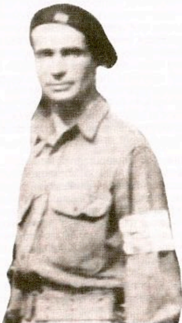
Le capitaine Gabriel HERBELIN, dit DUROC