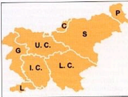
C : Carinthie, S : Styrie, U.C. : Haute Carniole, L. : Istrie, G : Goricka, L.C. : Basse Carniole, I.C. : Carniole intérieure, P : Prekmurje

Le démembrement de l'Autriche-Hongrie hongroise à l'issue de la Première Guerre mondiale conduisit à la formation d'Etats nouveaux, tels l'Autriche, la Hongrie, la Tchécoslovaquie, la Yougoslavie... Ce qui va générer des problèmes conflictuels de délimitations de frontières et de minorités.