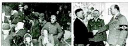
À gauche, Polonais expulsés de Pologne annexée ( Reichsgau Wartheland ) pour faire de la place aux Volksdeutsche , à droite, Arthur Greiser ( gauleiter du Wartheland ) accueille en 1944 le millionième Volksdeutsche 2 réinstallé en Pologne.

Le premier est le Hauptamt Volksdeutsche Mittelstelle , plus couramment appelé « VoMi », c'est-à-dire le «Bureau de liaison des Allemands de souche», qui prit en février 1937, du fait de son caractère inopérant au regard des objectifs nazis, la suite du Volksdeutsche Rat («Conseil populaire»)