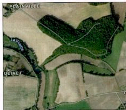
Le site du maquis de la Plaine.

Des combats auront lieu le 11 août entre les maquisards de la Plaine, recevant le renfort d'autres résistants venus des maquis de Beaumont et d'Auneau, avec les