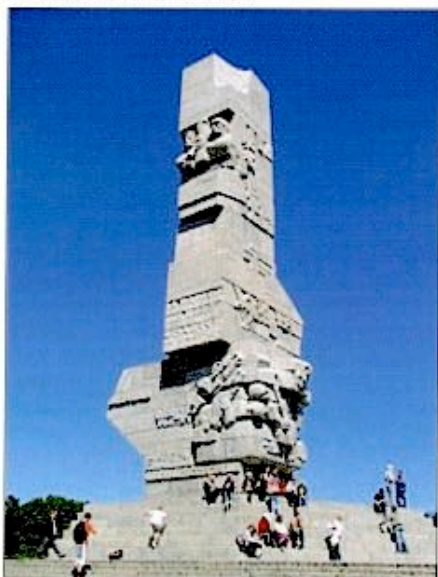
En souvenir du combat de la Westerplatte

Parallèlement à l'attaque nazie à Dantzig, la Wehrmacht était aussi passée à l'offensive contre la Pologne en Poméranie pour s'emparer du «Corridor de Dantzig». Cette agression conduit la France et la Grande-Bretagne à déclarer le 3 septembre la Guerre au Reich. Les premiers morts de la Seconde Guerre mondiale sont tombés à... Dantzig.