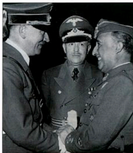
Rencontre entre Hitler et Franco à Hendaye le 23 octobre 1940 (au centre, le diplomate nazi von Stohrer)

Elle combattra à partir du 12 octobre 1941 sur le Front du Volkhov, dans le secteur de Novgorod, elle participera en 1942 et 1943 à plusieurs offensives du siège de Léningrad. A partir du 5 octobre 1943, elle