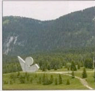
De gauche à droite : Tom Morel, des maquisards, le général de Gaulle rend hommage à ceux qui sont tombés. Le Monument National à la Résistance.

Lors de la Conférence de Téhéran, qui avait réuni dans la capitale de l'Iran, du 28 novembre au 1 er décembre 1943, Churchill, Roosevelt et Staline, avait été décidée l'organisation d'un débarquement en Normandie ; la période de mai-juin 1944 étant retenue.