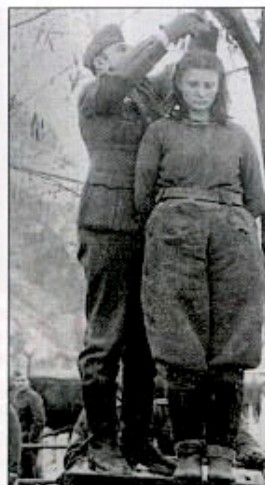
Lepa Radic, jeune partisane de 17 ans, membre du KPH-KPJ, exécutée le 8 février 1943 en Bosnie (NDH)

de montagne Prinz Eugen ) contre de 20 000 à 25 000 Partisans ; deux films, la Bataille de la Neretva (1969) et Sutjeska (1973), retraceront l'épopée de la rupture par les partisans de leurs encerclements. Fin 1943, malgré ces offensives ennemies, et les pertes subies, plus de 100 000 partisans combattent en Croatie.