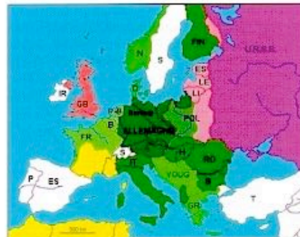
L'EUROPE EN 1941, AVANT L'ATTAQUE CONTRE L'URSS En vert très foncé, le Reich et l'Italie, en vert foncé leurs Alliés (Hongrie, Roumanie, Bulgarie, Slovaquie, Finlande), en vert clair les pays occupés (Belgique, Pays-Bas, Norvège, Danemark, ouest de la Pologne, moitié nord de la France, Yougoslavie, Grèce), en jaune l'«Etat français» (zone sud de la France, Maroc, Algérie, Tunisie), en rose la Grande-Bretagne, en violet l'URSS et ses extensions (Estonie, Lettonie, Lituanie, est de la Pologne). Et en blanc les Pays neutres : Irlande (Eire), Portugal, Espagne, Suède, Suisse et Turquie.

À la fin du conflit, le Gouvernement suédois va, via ses diplomates, avoir un rôle positif bien mieux connu – parce que médiatisé par de nombreux articles et films après-guerre – que les compromissions