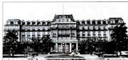
Le Palais Wilson à Genève, siège de la Société des Nations de 1920 à 1936

Et ce d'autant plus que se multiplient à travers le monde les «Comités de la France Libre» donnant naissance aux représentations du Comité Français de la Libération Nationale (CFLN), qu'au fil des mois de plus en plus d'Etats reconnaîtront. Après la Libération, la reconnaissance de jure du