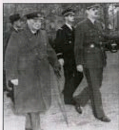
11 novembre 1944, sur les Champs-Élysées, Churchill, De Gaulle, un défilé militaire allié, avec des unités FFI, et le Comité Parisien de la Libération.