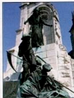
Le monument de La Couture

D'autres vont fonder des associations ou organisations spécifiques, tournées vers la patrie d'origine : ce sera le cas des réfugiés politiques – tels l'ancien premier ministre José Domingues dos Santos ou l'ancien négociateur portugais à la Conférence de la Paix à Versailles, Afonso Costa – qui vont fonder en 1927 la « Liga de Defesa da Republica » appelée « Liga de Paris ».