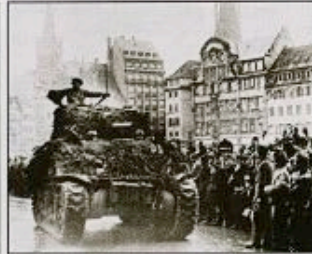
La 2 e DB libère Strasbourg.

En cette fin 1944, si la date de la Victoire reste incertaine, sa certitude ne fait plus de doute. Le Reich nazi a vu le nombre de ses alliés se restreindre mois après mois: déjà en octobre précédent, après la chute du régime fasciste mussolinien, le gouvernement italien s'était rangé au côté des Alliés, amorçant un processus qui s'est accéléré depuis le début de l'Année 1944.