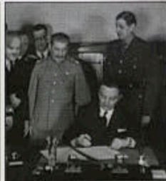
Signature du Traité d'Alliance et d'assistance mutuelle franco-soviétique.