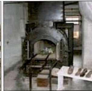
Les camps de Natzweiler-Struthof, avec le four crématoire.