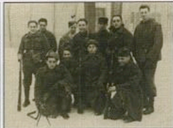
Partisans français (prisonniers et STO évadés d'Allemagne) participant au soulèvement National Slovaque.