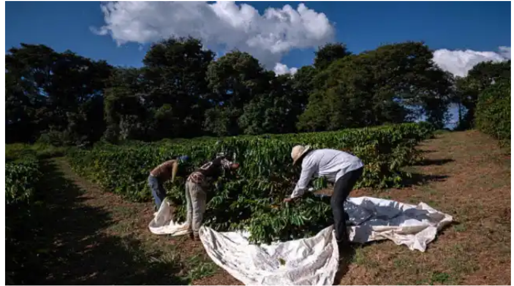
¿De dónde viene el café que está bebiendo? Por qué es importante saber el origen de lo que se consume