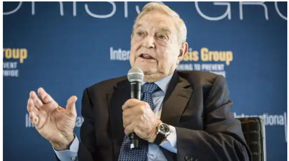
El día en que George Soros dio el pelotazo de su vida apostando contra la