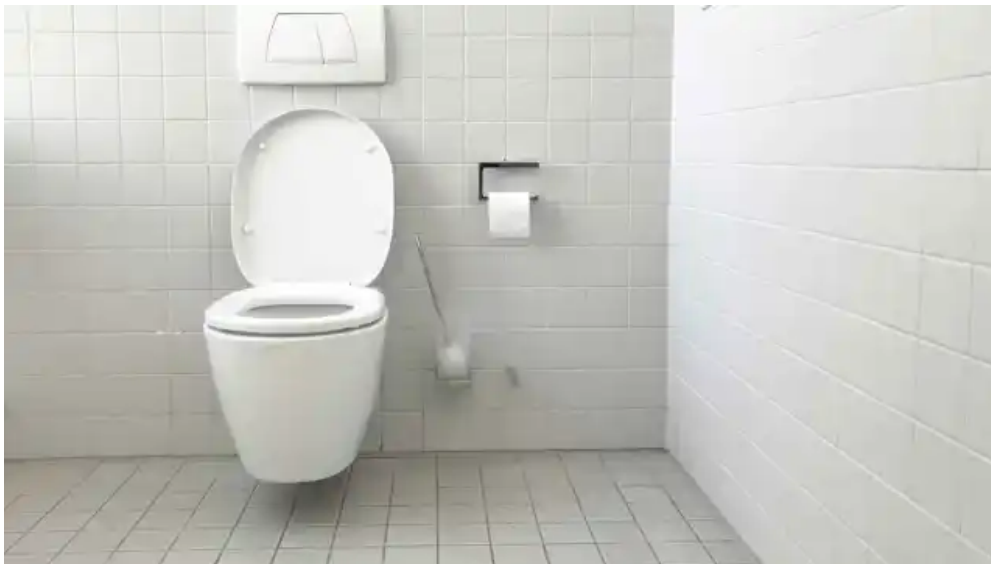
Este producto que tiene en el baño contiene partículas contaminantes con