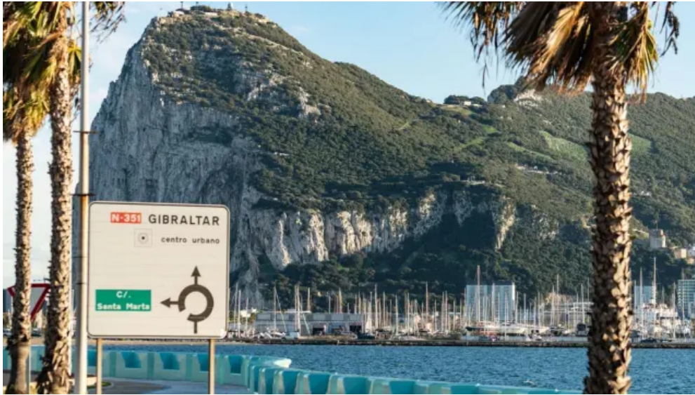
Aquí España empezó a perder Gibraltar: esto es lo que pasó en el Tratado de Utrecht