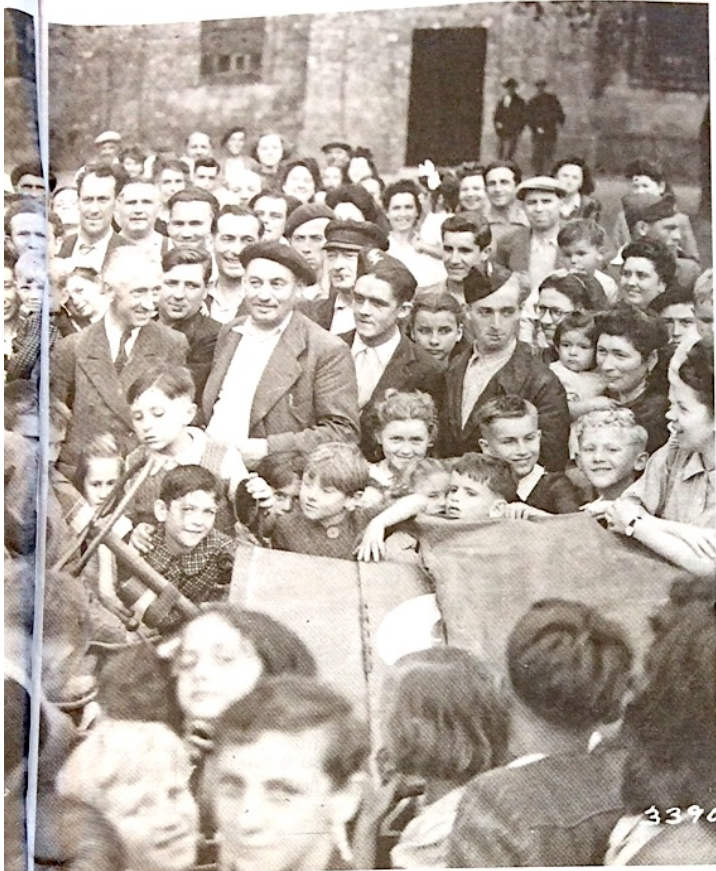
Dans les villes bretonnes, les libérateurs sont accueillis triomphalement. Ici, à Plouay (56), le lieutenant américain Bell, assis sur sa Jeep, attire une foule de curieux.