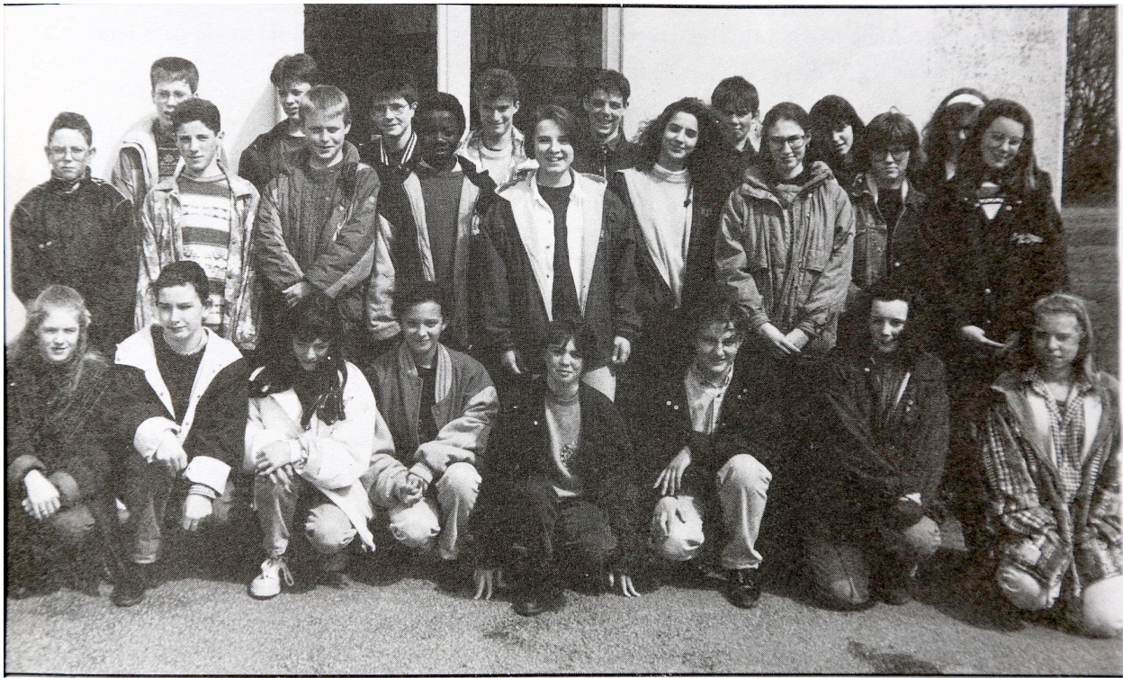
La classe de 4 e D 93 - 94 du Collège Beg Avel, qui a recueilli les témoignages