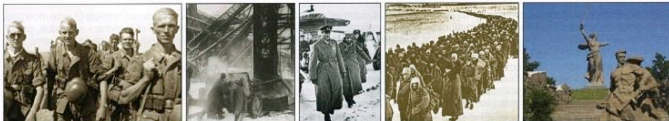
De g. à d. : La Wehrmacht en marche vers Stalingrad. Immeuble par immeuble, ici canon soviétique en action dans une usine. Reddition de Paulus et de son état-major. Colonne de prisonniers allemands, roumains, hongrois, italiens... Sur la colline Mamaïev, haut-lieu des combats de Stalingrad, la statue «l'Appel de la Mère-Patrie !», haute de 85 m ; 35 000 soldats soviétiques sont inhumés là.

Sept mois après le début de leur attaque contre l'Union soviétique le 22 juin 1941 (l'«Opération Barbarossa»), les forces allemandes, que sont venues épauler des troupes hongroises, roumaines et finlandaises, avaient été stoppées devant Leningrad – qu'elles assiègent – et Moscou, et au sud-est de l'Ukraine, quasi-totalement conquise.