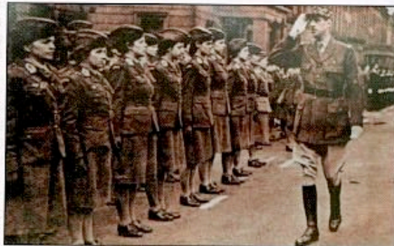
De Gaulle passe en revue des troupes de la France Libre à Londres.

Je ne voudrais pas donner l'impression que les responsables de la Résistance, dont je décris les désaccords, se comportaient comme des crabes dans un panier, s'entre-déchirant en querelles basses intéressées tandis que les résistants de la base, avec abnégation, risquaient leur vie. Tous étaient des hommes de caractère et de foi, chacun convaincu de la justesse de ses conceptions, chacun confronté à ses propres problèmes, ignorant parfois, en raison du manque d'informations lié à la clandestinité, les préoccupations des autres. Tous soumis à un régime de vie difficilement supportable et à des tensions nerveuses terribles, Qu'ils se soient heurtés les uns aux autres, qui s'en étonnerait ? Ce qui n'excuserait pas, naturellement, les chausse-trapes de la trahison tendues sous les pieds d'un camarade de combat. Ce qui ne justifie pas que, longtemps après, le temps de la réflexion seraine venu, la plume à la main, certains