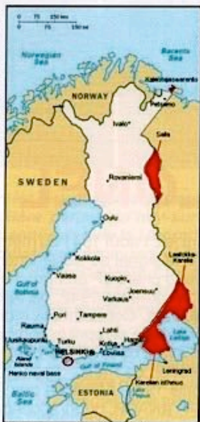
En rouge, les territoires cédés à l'URSS.

Après la Guerre, 1 381 Finlandais furent poursuivis pour leur rôle répressif dans les camps de prisonniers soviétiques, où 18 318 des 64 188 internés moururent. L'ancien Président Risto Ryti, convaincu – avec 7 autres anciens dirigeants – de responsabilité dans l'entrée en guerre de la Finlande aux côtés de l'Axe, sera condamné en 1946 à 10 ans de prison... et libéré 3 ans plus tard.