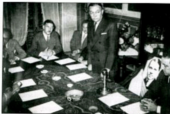
Reconstitution de la 1 re réunion du CNR, avec la photo de Jean Moulin à la place qu'il occupait. Debout, son successeur à la Présidence, Georges Bidault.

La frustration fut telle qu'un certain nombre de pièces ou de rapports rendant compte de la réunion du 27 furent datées du 25. Comme si cette date du 25 mai était restée gravée dans les têtes...»