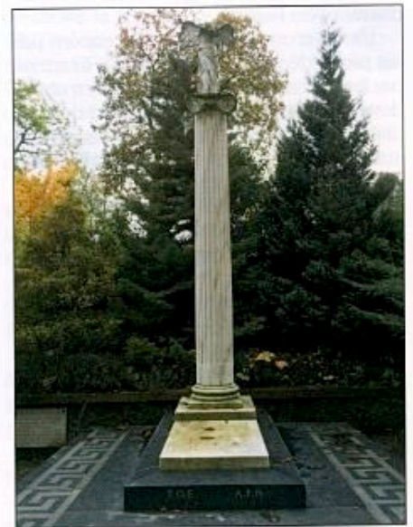
Au cimetière du Père-Lachaise à Paris, le monument aux Volontaires grecs Morts pour la France.