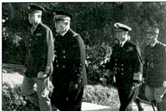
À Alger de g. à d. fin 1942 : Eisenhower, Darlan, l'amiral britannique Cunningham et... Giraud.

Le 26, Brossolette avait mis sur pied son Comité de coordination, constitué malgré les instructions de De Gaulle et dans lequel il avait réuni cinq mouve-