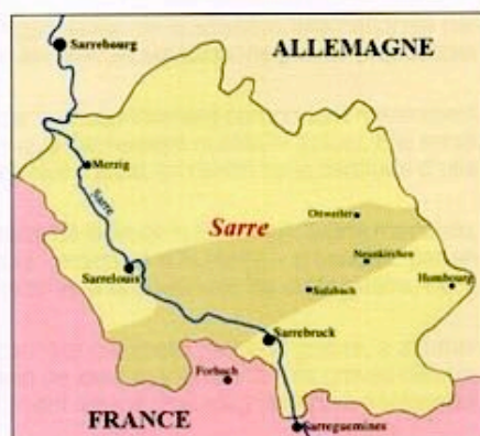
En grisé, le bassin houiller.

Le 27 février, le siège du Parlement allemand, le Reichstag, brûle. Les nazis – dont il apparaîtra ultérieurement qu'ils sont à l'origine de l'incendie – accusent les communistes du sinistre. Dès la nuit du 27 au 28 février, 4 000 cadres communistes et opposants sont incarcérés, le 3 mars, Ernst