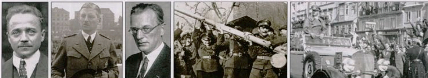
De g. à d. : Le Chancelier Engelbert Dollfuss, son successeur le Chancelier Kurt von Schuschnigg, Arthur Seyss-Inquart, chef du Parti nazi autrichien. Démolition d'un poste-frontière entre l'Autriche et l'Allemagne. Hitler entre triomphalement à Linz.

Au printemps 1918, après près de 4 années de participation à la Première Guerre mondiale aux côtés de l'Allemagne, de l'Empire ottoman, et de la Bulgarie, l'armée austro-hongroise est épuisée et au bord de la rupture, minée par les revendications nationales des peuples minoritaires de l'Empire (Croates, Tchèques, Slovaques, hongrois...).