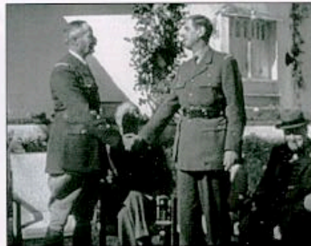
A Anfa, la poignée de mains contrainte de Gaulle et de Giraud.

communistes incarcérés s'étaient adressés sans succès à Eisenhower, ils renouvellent leur démarche le 11 janvier 1943 par une lettre à Giraud. Lequel, après avoir reçu deux d'entre eux, François Billoux et Lucien Midol, fera libérer sans conditions les 27 le 5 février 1943 13 ; ils formeront la délégation du P.c.f. en Afrique du Nord, que viendra rejoindre depuis Moscou André Marty 14 .