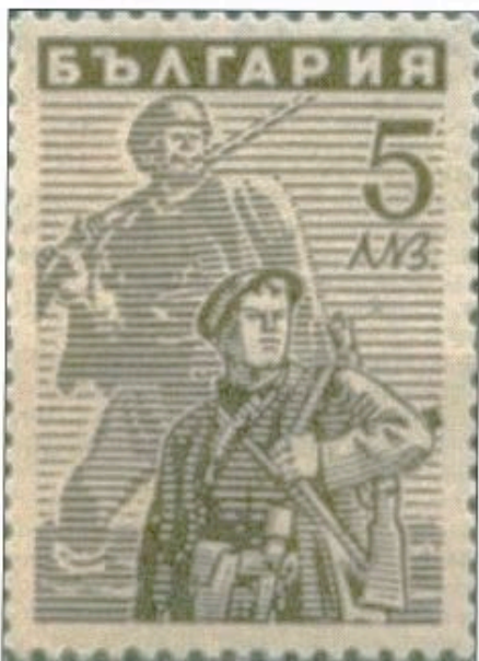
Timbre de 1946 à la gloire des Partisans.

De fait, la politique suivie par les dirigeants bulgares depuis l'adhésion de la Bulgarie au Pacte tripartite le 1 er mars 1941 et les liens de plus en plus étroits l'attachant à l'Allemagne ont suscité de vives oppositions ; non seulement dans la population, mais aussi dans les classes dirigeantes et même l'armée. Ainsi, le général Vladimir Zainov, hostile à toute collaboration avec l'Allemagne, sera