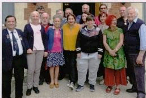
Le stage national de l'anacr s'est déroulé du 11 au 13 mai (voir p. 20).