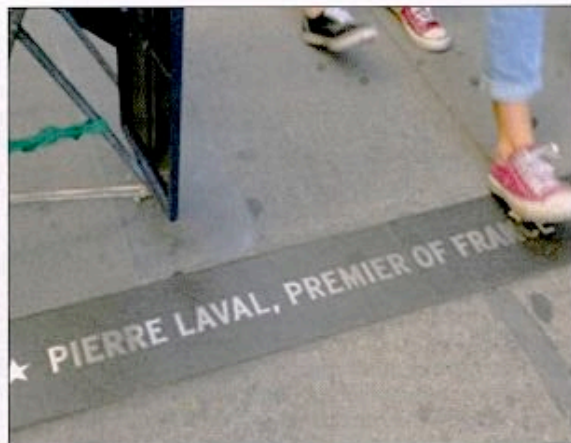
Sur le «Canyon des Heroes» à Broadway, l'une des principales avenues de New-York...

Samedi 12 août 2017, à Charlottesville, petite ville universitaire de l'Etat américain de Virginie, l'extrême-droite avait, sous le mot d'ordre « Unite the Right » (Unir la droite), rassemblé des suprématistes blancs, des néonazis, des membres de l' Alt Right (Droite alternative), des nationalistes de Vanguard America , des miliciens. Et ce pour protester contre le déboulonnage d'une statue de Robert Lee, l'un des généraux les plus emblématiques du camp sudiste esclavagiste lors de la guerre de Sécession au 19 e siècle.