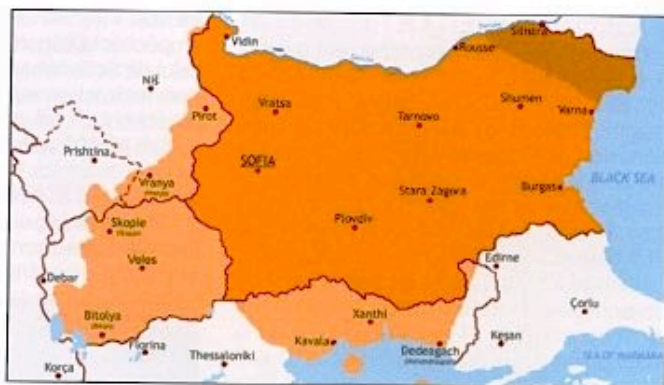
En orange le territoire bulgare En orange clair : Les territoires annexés en 1941 En orange foncé : La Dobroudja du Sud

d'Etat. 9 mois plus tard, se sentant menacé dans son statut royal, le Tsar Boris III suscite le 22 janvier 1935 un autre coup d'Etat qui renverse Georgiev.