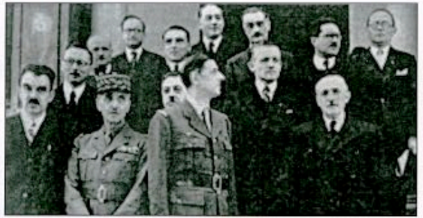
Le Comité Français de Libération nationale.

Lors d'une conférence qui réunit dès le 31 mai, Giraud, Monnet et le général Georges d'une part, et d'autre part René Massigli, André Philip, Catroux et le général de Gaulle, ce dernier demande la constitution d'un véritable gouvernement et exige – ce qu'au départ Giraud refuse – le départ des pétainistes les plus compromis, Boisson, Noguès, Peyrouton... ; ce dernier présentera directement sa démission à de Gaulle, ce qui ulcère Giraud. Noguès démissionnera à son tour le 2 juin.