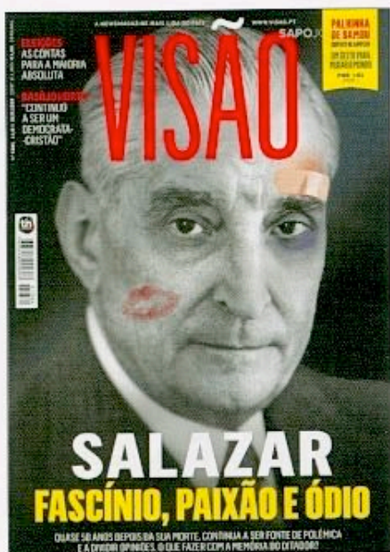
«Une» en septembre 2019 de l'hebdomadaire Visao : «Salazar, fascination, passion et haine».

nomène particulièrement pervers et surprenant : la tentative de réhabilitation du personnage détestable qu'a été le dictateur réactionnaire Antonio de Oliveira Salazar... »