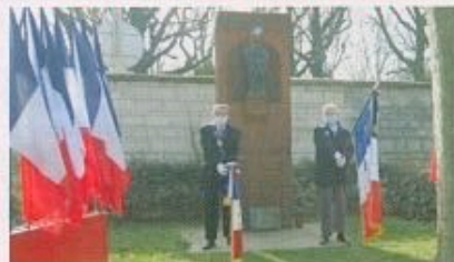
Le dimanche 21 février, comme chaque année, l'ANACR a rendu hommage aux martyrs du « Groupe Manouchian-Bocsov » des FTP-M.O.I. fusillés par les nazis le 21 février 1944 au Mont-Valérien.