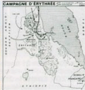
Les raids sur Mourzouk et Koufra, Leclerc à Koufra ; La bataille de Keren, de Gaulle le 30 mars 1941 sur le front d'Erythrée

Le 17 juillet 1940, Félix Eboué, gouverneur du territoire du Tchad, dépendant de l'Afrique Equatoriale Française (A.E.F.) informe le général de Gaulle de son ralliement à la France libre, précédant ceux des autres territoires de l'A.E.F., le Congo et le Cameroun les 28 et 29 août, l'Oubangui-Chari le 30 août, et le Gabon le 19 novembre.