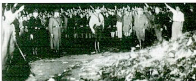
Autodafé en Allemagne nazifiée

dam, le congrès antifasciste européen de Paris va être préparé en France, comme dans les autres pays où c'est possible, par des assises locales, départementales et régionales ; non sans difficultés, les refus de salles se multipliant. Ainsi les organisateurs du Congrès régional de Paris se verront-ils refuser la salle Bullier, Magic-City, la Mutualité, Japy, le Trocadéro ; la direction du Cirque d'Hiver précisera ; « Si c'est pour le Congrès communiste antifasciste, je ne peux vous donner la salle... ». Il fallut donc se replier sur une salle ouvrière de la Maison des syndicats 33 rue de la Grange-aux-Belles, où se rassemblèrent, les 27 et 28 mai 1933, 1032 délégués de la Région parisienne.