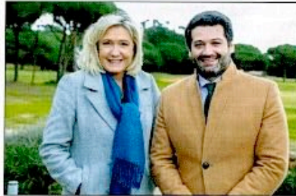
Marine Le Pen : «Je suis au Portugal pour soutenir notre ami et allié André Ventura, candidat à la présidentielle portugaise qui aura lieu le 24 janvier [2021] prochain !».

télévision, commentateur sportif et de faits divers, docteur en droit, André Ventura (38 ans) a d'abord milité au sein du Parti Social-Démocrate (PSD) de centre-droit avant de fonder « Chega », dont la première prestation électorale, au sein de la coalition « Basta » 19 qu'il conduira lors de l'élection européenne de mai 2019, sera décevante : 1,49%.