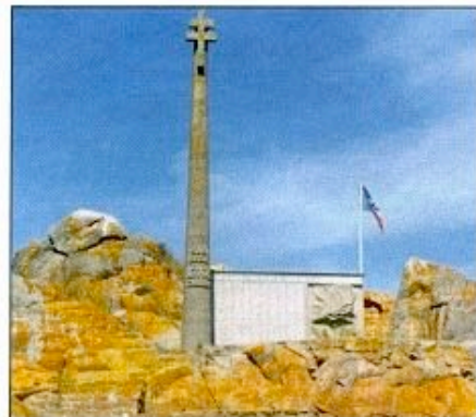
Le Monument du Diben à la mémoire des Patriotes bretons ayant rejoint les FFL.

lant 4 autres Résistants du mouvement Libé-Nord fusillés le 6 juillet 1944, Stèle du Port du Diben portant l'inscription «18 juin 1940/Oiseau de la tempête» 21 , inaugurée le 8 août 1948 lors du Pardon du Diben, en présence du médecin général Sicé représentant le général de Gaulle et de Jean-Marie Hervé, patron du bateau, et Monument du Diben, érigé sur un îlot et inauguré le 18 juin 1955, à nouveau en présence du médecin général Sicé, par l'Association Sao Breiz 22 en mémoire de 288 patriotes bretons 23 partis rejoindre les FFL, il a été restauré en 2000.