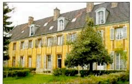
Le «Château» de Leuville-sur-Orge, siège du Gouvernement géorgien en exil.

Leuville-sur-Orge va devenir ainsi la «capitale» de la République démocratique géorgienne, dont le gouvernement en exil à Leuville apportera en 1924 son concours à un soulèvement national dans le pays. Où s'est installée une «République socialiste soviétique» (RSS) fédérée dans l'URSS 3 , à qui elle fournira, jusqu'au terme de son existence en 1990, plusieurs dirigeants éminents. Le premier étant un certain Iossif Vissarionovitch Djougachvili, plus connu sous le nom de... Staline ; l'on peut citer aussi «Sergo» Orjonikidzé, Lavrenti Béria, et plus récemment, déjà évoqué, Édouard Chevarnadzé 4 .