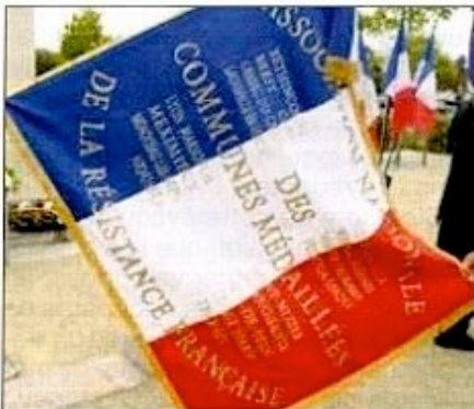
Le Drapeau de l'Association des communes médaillées

Le 31 mars 1947, nous l'avons vu, la commune de Plougasnou se vit décerner la prestigieuse «Médaille de la Résistance».