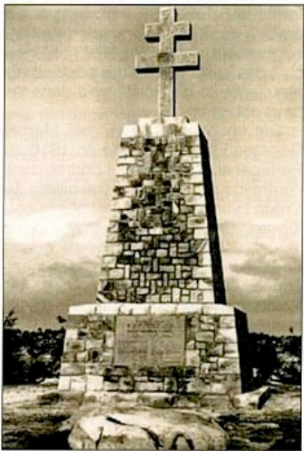
Élevé sur le pignon de la Roche au Four, sur le site du projecteur de liaison lumineuse avec les avions venant procéder à des parachutages, ce monument surmonté d'une Croix de Lorraine de 10,30 m en hommage aux Résistants fut inauguré le 22 juin 1946 en présence du général français Revers, chef d'état-major général de l'Armée de terre, du maréchal britannique Salisbury, du colonel Maurice Buckmaster.

Le réseau «Publican», reconnu unité combattante du 1 er février 1943 au 20 septembre 1943, et qui sera homologué comme réseau de la France Combattante (F.F.C.) le 19 juin 1947, a regroupé 45 agents permanents (dont 18 gardant une activité personnelle), et 44 occasionnels. Il aura eu six tués dont l'un de ses deux chefs, Marcel Fox, et 15 déportés.