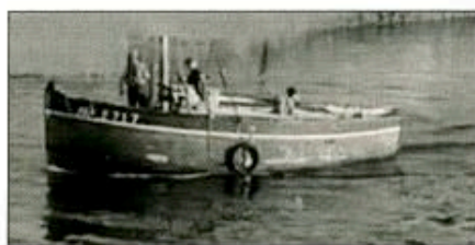
«L'Oiseau de la tempête», vers l'Angleterre...

Le 18 juin, à Londres, le général de Gaulle, sous-secrétaire d'État dans le gouvernement Reynaud, lance sur les ondes de la BBC un appel à poursuivre le combat, invitant « les officiers et les soldats français, qui se trouvent en territoire britannique ou qui viendraient à s'y trouver, avec ou sans leurs armes » à se mettre en rapport avec lui.