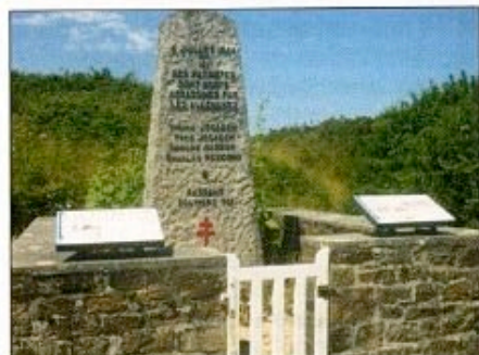
La Stèle de Ruffélic