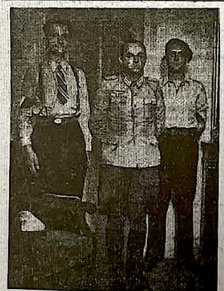
Les F.F.I. de Paris ont fait prisonnier un commandant allemand. C'est peut-être un assassin d'enfants soviétiques.