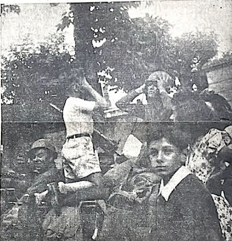
Les blindés américains arrivent à Rambouillet. Un garni, monté sur l'auto-mitrailleuse, sympathise déjà avec un Samy.

Les Alliés ne sont pas encore entrés à Paris. Mais Paris est libre de presque entièrement. Les Alliés ont franchi la Seine et foncez vers Meaux. Les Alliés ont franchi la Seine et foncez vers Meaux. Les Alliés ont franchi la Seine et foncez vers Meaux.