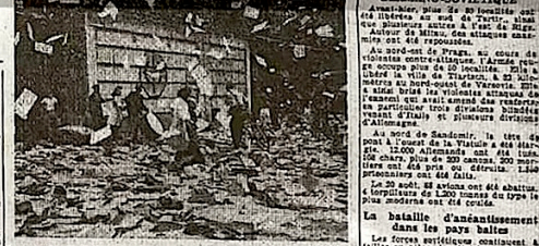
Le peuple de Paris a chassé les allemands de la rue de Valenciennes. Le siège du P.F.I. rue des Bénédictins, occupé par les forces françaises.

Partout l'avantage reste aux patriotes. Après les bagarres des jours précédents, trois chars ont été pris et ont été remis en état. Les chars allemands ont été détruits. Les chars allemands ont été détruits. Les chars allemands ont été détruits.