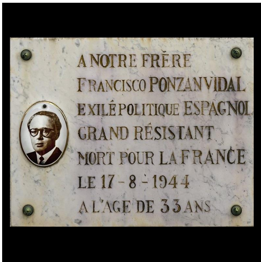
Honneur et gloire.