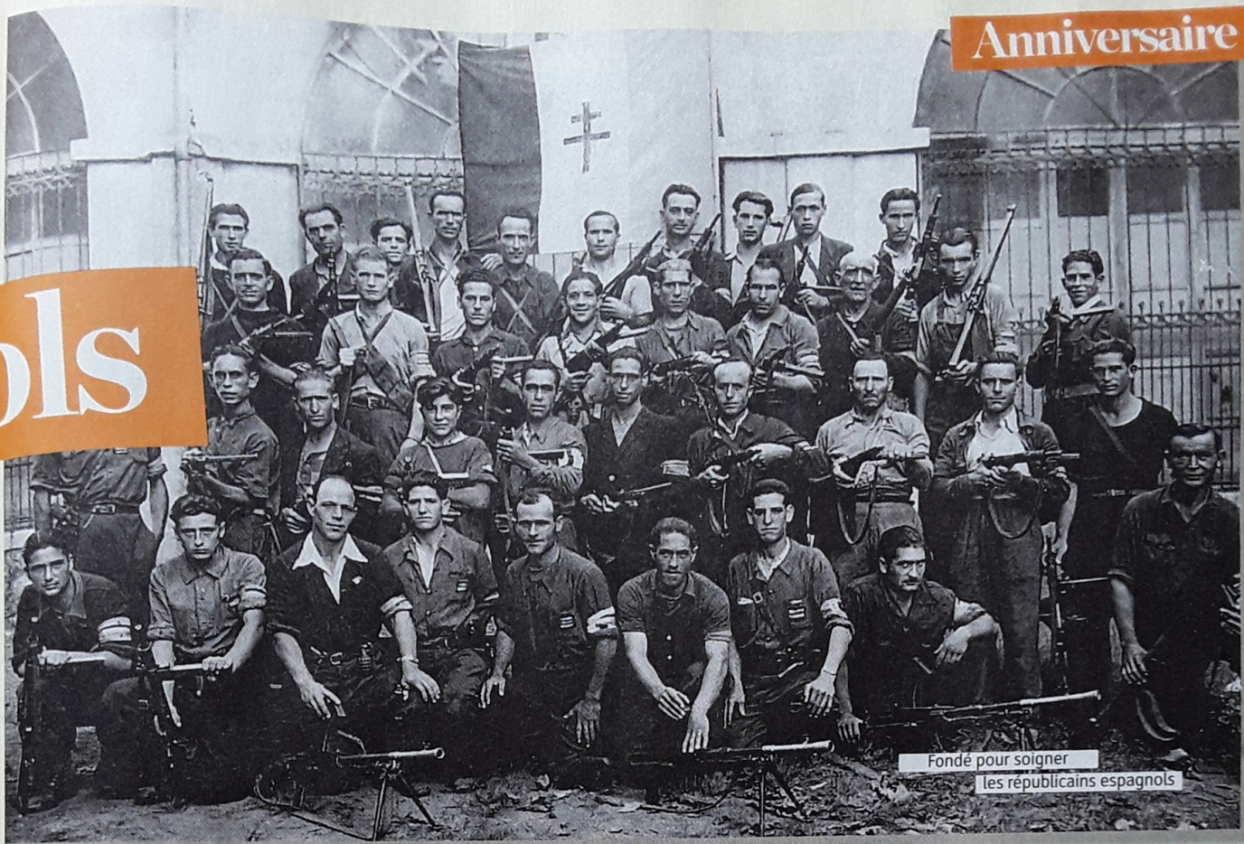
Fondé pour soigner les républicains espagnols