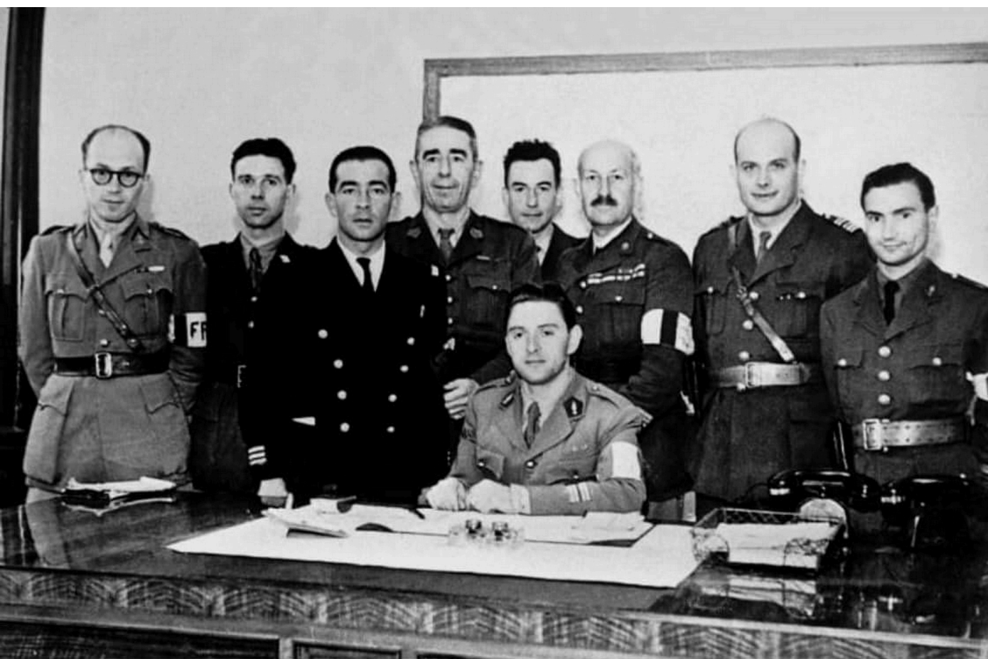
Henri ROL-TANGUY et debout derrière lui l'état major des FFI de la Libération de Paris , dans les Catacombes sous la place Denfert -Rochereau