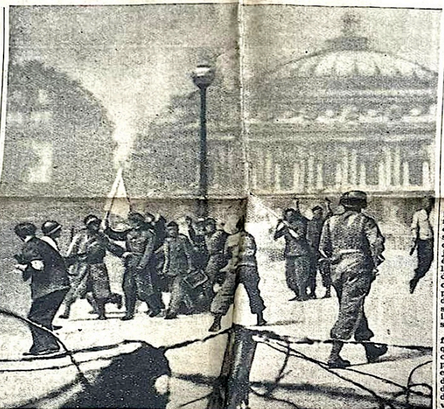
La prise de la Kommandantur de l'Opéra par les soldats de l'armée Leclerc et les F.F.I.

Le débarquement une fois effectué, les F.F.I. ont joué un rôle militaire essentiel. Hommage doit être rendu au Comité d'action militaire (C.O.M.A.C.) du Conseil National de la Résistance qui avait, sur le sol français, préparé avec un remarquable esprit de prévision l'action immédiate des forces de la Résistance. Les F.F.I. se sont révélés comme des troupes dont l'intervention est d'une extrême importance dans la guerre moderne, à base d'engins blindés. En Bretagne, par exemple, on a vu des chars protégés par leurs blindages, renforcés par de grandes vitesses dans les territoires occupés par l'ennemi, tandis que l'insurrection motorisée ne pouvait progresser dans un sillage qu'avec une certaine prudence, les