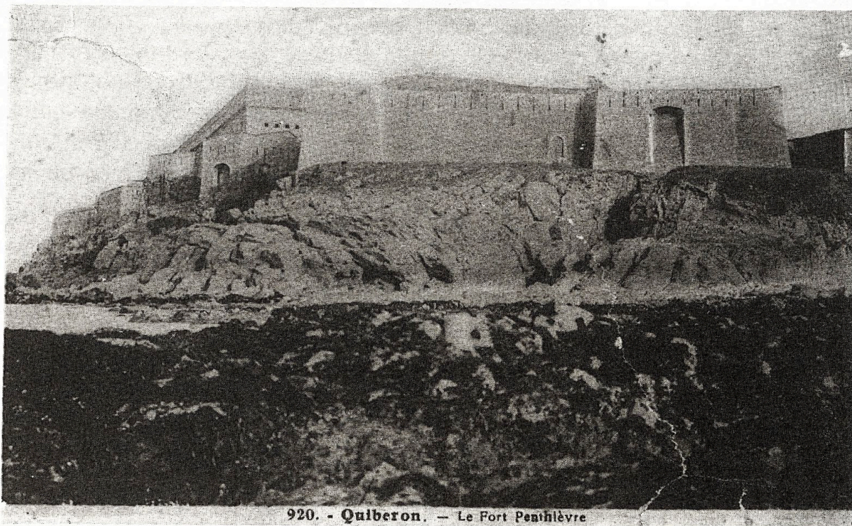
920. - Quiberon. - Le Fort Penthlèvre