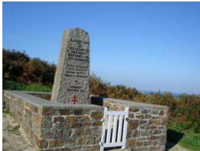
Stèle de Ruffélic- Plougasnou