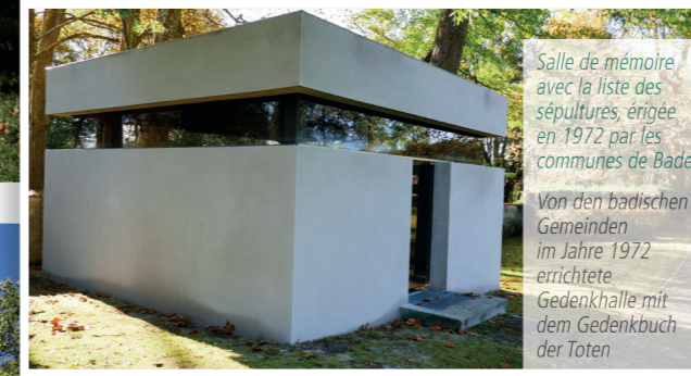
Salle de mémoire avec la liste des sépultures, érigée en 1972 par les communes de Bade Von den badischen Gemeinden im Jahre 1972 errichtete Gedenkhalle mit dem Gedenkbuch der Toten