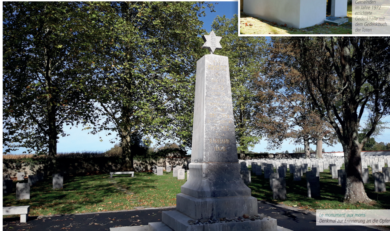
Le monument aux morts Denkmal zur Erinnerung an die Opfer