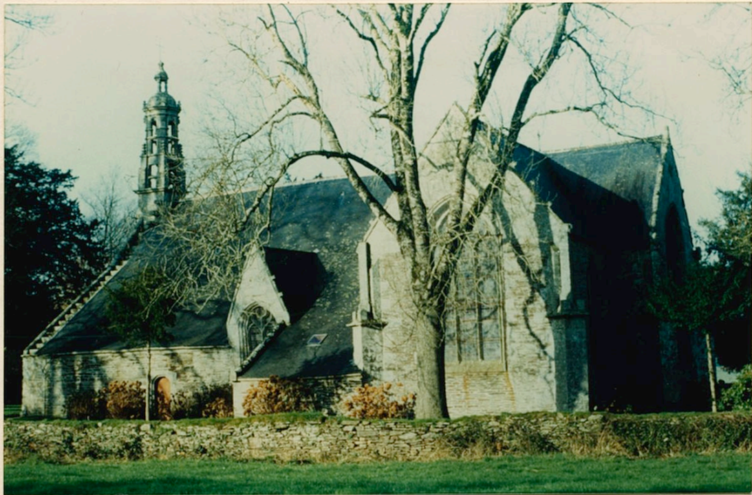
la Chapelle N.D. du Crann