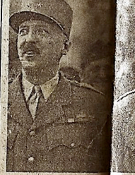
Le général Eisenhower placé de l'Étoile.

Le conseil des ministres a pris des décisions