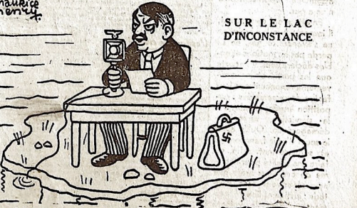
SUR LE LAC D'INCONSTANCE

Le conseil des ministres a pris des décisions