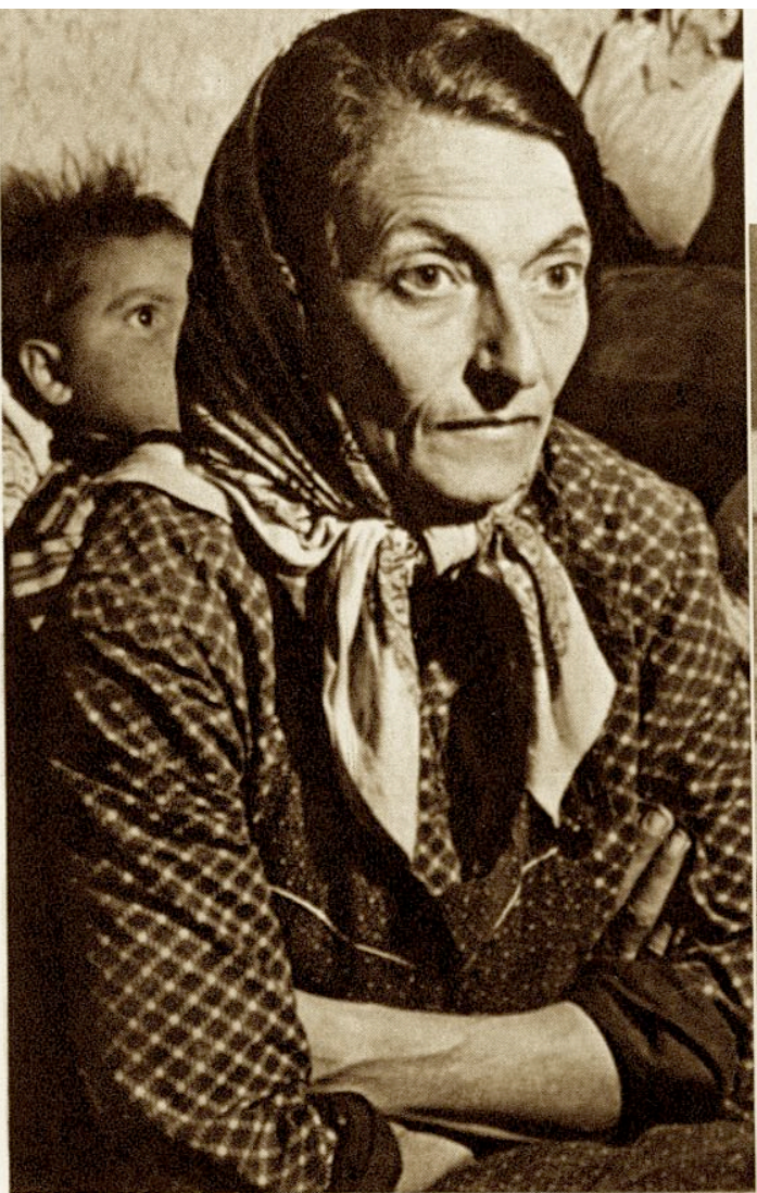
Elle est prête à tout subir pour que son petit connaisse une existence normale.