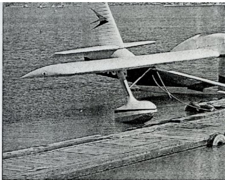
Le Sea-Bee, monomoteur quadriplace qui

Le décollage est plutôt facile sur ce type d'engin. En attendant que l'avion, moteurs au ralenti se positionne de lui-même face au vent comme le ferait la girouette d'un clochet, on vérifie les derniers paramètres. Le choix de la position des volets pour le décollage est simple : pleins volets (il n'y a que deux positions possible!). Une fois que l'avion prend de la vitesse, le décollage se fait en deux temps : au bout de quelques secondes, l'eau devient plus "dure" à mesure que la vitesse augmente et l'avion sort de l'eau en ne gardant qu'un contact très superficiel. Puis dès que la vitesse