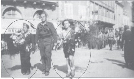
A la libération, Microbe à gauche et moustique à droite au centre le cuisinier de l'état-major

Malgré tout, je suis resté jusqu'à la fin et tu m'as placé avec le capitaine Crolus jusqu'au retour à Bergerac, et nous nous sommes quittés, car je n'ai pas pu m'engager. Et nous nous sommes perdus de vue pendant plus de trente ans. En ce qui concerne le groupe