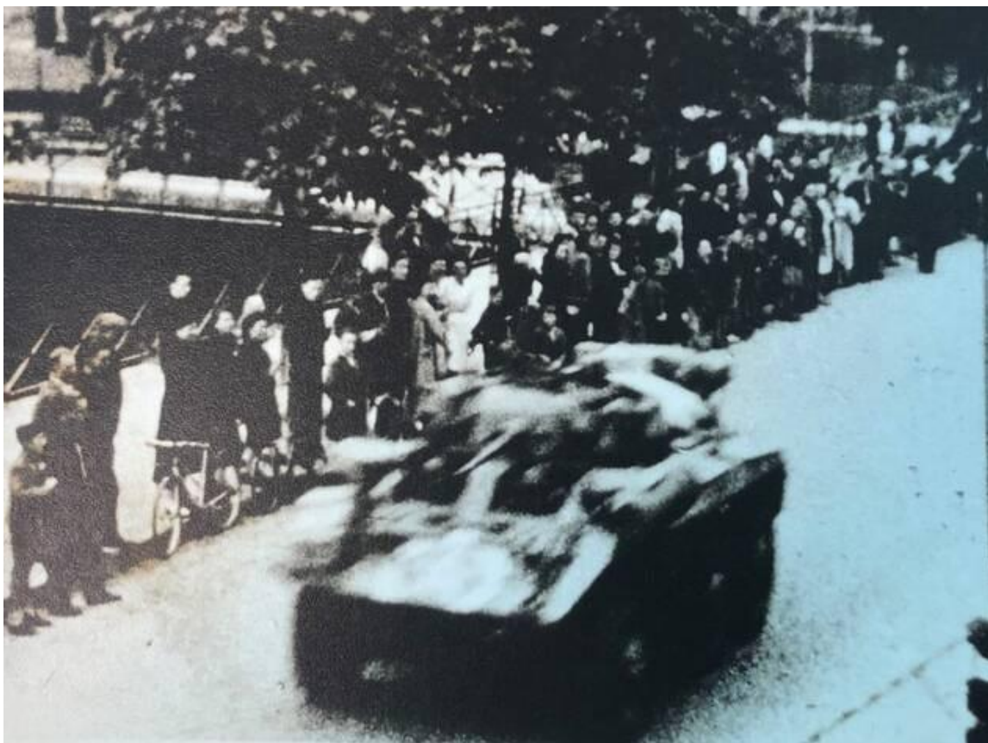
Char américain entrant dans Quimper, le 22 septembre 1944.